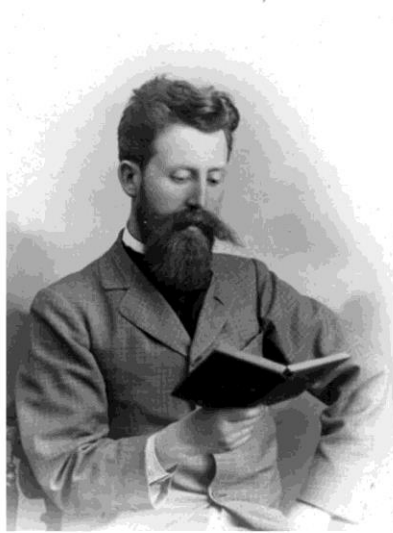
Пол Видал де Ла Блаш (1845–1918)