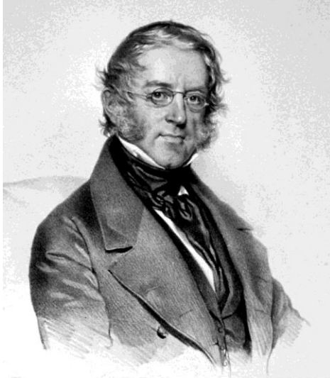
Карл Ритер (1779–1859)