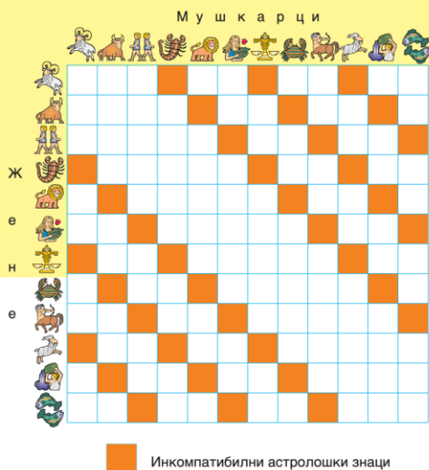
Слика 10. – (Sydney Omarr)

ПИТАЊЕ АСТРОЛОЗИМА: Зашто се различите астролошке школе тако оштро разилазе у својим схватањима?