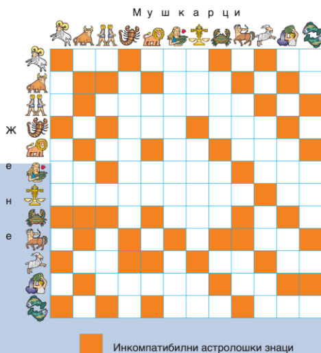
Слика 8. – (Carroll Righter)

Веровање да се помоћу астролошког знака може одредити опис нечије личности или његове судбине, логично доводи до веровања да ти знакови утичу и на то да ли ће се неке особе добро или лоше међусобно слагати и разумети. У последње време, пратећи пораст интересовања и све већи број бракова склопљених на основу слагања астролошких знакова, такви брачни хороскопи постали су најпопуларнија манифестација те врсте астрологије.