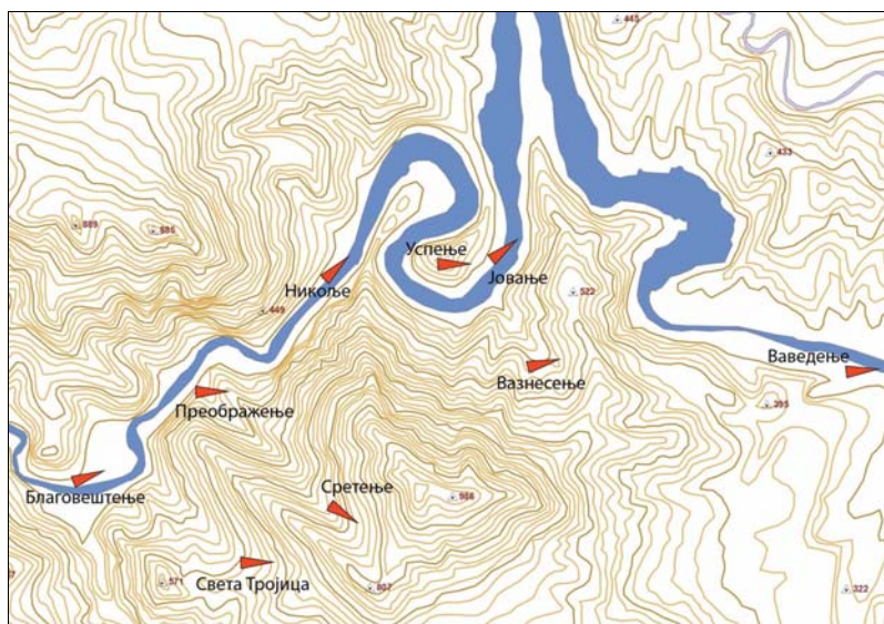
Figure 6. Orientation of the monastery churches of Ovčar-Kablar gorge

Due to the lack of historical data and thorough archeological researches, former appearance, founder, chief architect and the year of construction of the majority of the monastery churches of Ovčar-Kablar gorge have not been familiar. Also, it has not been known whether the original churches were erected on older cult sites and whether and at what extent the chief architects of the restored churches followed the orientation of the previous ones. This also conditioned the degree of accuracy of the conclusions on the meaning of their orientation.