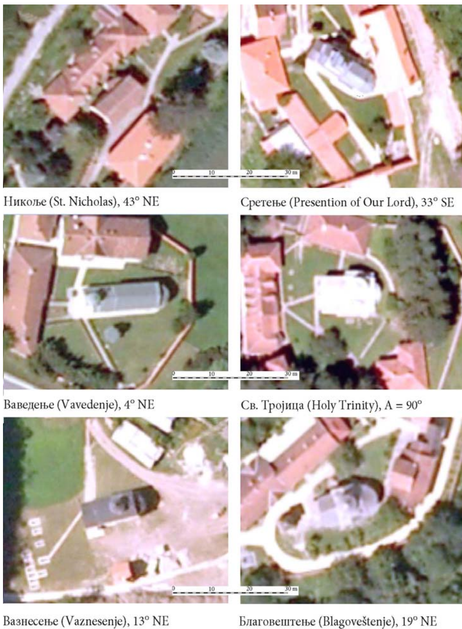
Figure 3. Orthography of the churches of six monasteries in Ovčar-Kablar gorge ( http://www.geosrbija.rs/ ) with entered deviations from the East point : NE – towards north-east, SE – towards south-east.

(Mirković L., 1966), he did it around 25 th September – and it has to be added- not knowing that the equinox had been some ten days earlier.