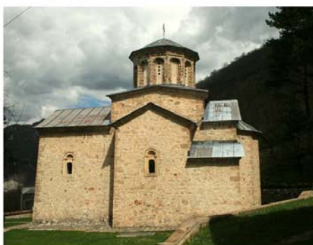
Св. Тројица (Holy Trinity)