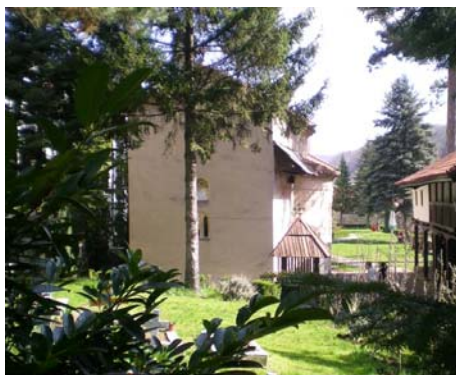
Никоље (St. Nicholas)

century or at least at the beginning of the 16 th century. The current church has preserved the orientation of the former one: “The walls of the former temple, before the restoration in 1818, have probably been preserved up to the height of choir loft” (Rajić D. and Timotijević M., 2012, page 348).