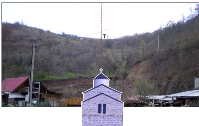
Figure 5. Eastern sector of perceptible horizon of the church of Vaznesenje

The church of the Holy Trinity, one of the monastery churches of Ovčar –Kabljar gorge that belongs to the extended Serbian Middle Ages, is perfectly oriented in mathematical-geographical sense. It is situated high above/opposite to spa Ovčar banja, at the source of the stream Troički potok. There are no certain data on the year of the construction, its founder and chief architect. However, it is certain that it was built in the second half of the 16 th century (the monastery was first mentioned in 1572), that the founder was rich and that the chief architect was a follower of the Raška School and a connoisseur of space orientation. It was built according to the ideal of the Church of St Achillius in Arilje (Rajić D. and Timotijević M., 2012) which is also accurately oriented towards the sides of the world (Tadić M., 2012).