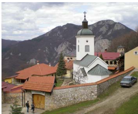
Сретење (Presentation of Our Lord)